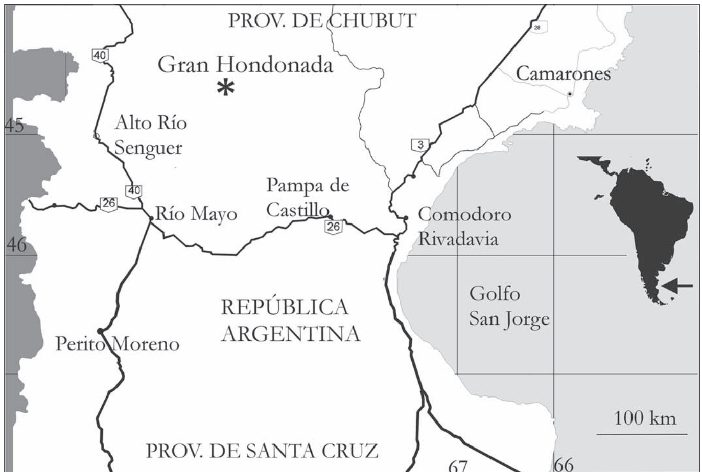
Figura 1. Mapa de ubicación. Location map.

En sus depósitos son frecuentes los restos de mamíferos terrestres a partir de los cuales se identificaron las edades mamíferos Casamayorensis, Mustersense, Deseadense y Colhuehuapense (Pascual et al. , 1996, 2002).